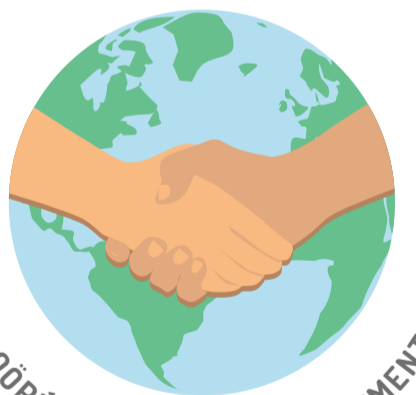
COOPÉRATION AU DÉVELOPPEMENT