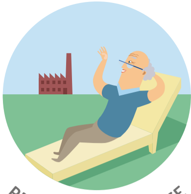
PENSIONS DE RETRAITE