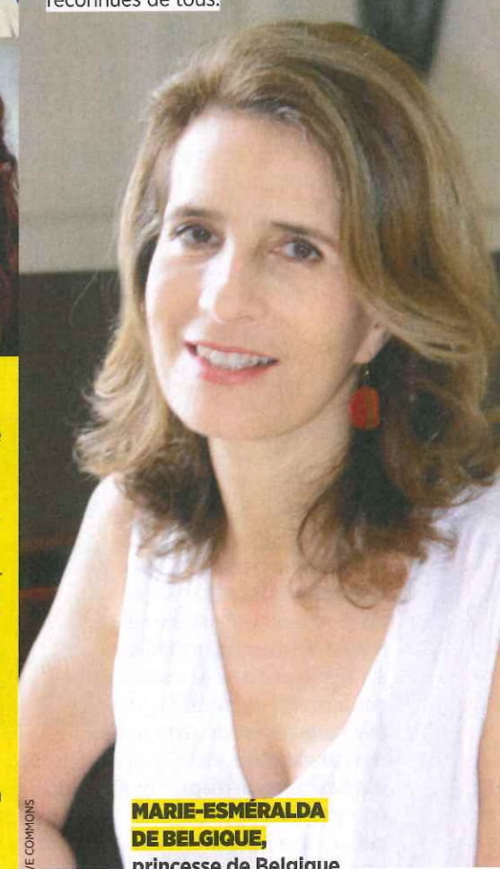
MARIE-ESMÉRALDA DE BELGIQUE, princesse de Belgique

Journaliste et écrivain, la princesse est aussi une grande défenseuse du droit des femmes et de l'environnement.