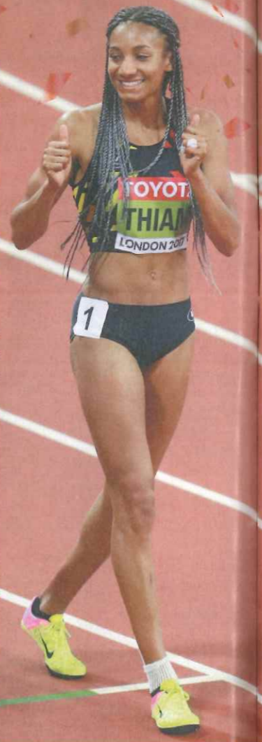
NAFISSATOU THIAM, championne d'athlétisme