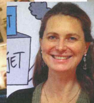
ISABELLE PHILIPPE, directrice du Crédal

Cette Bruxelloise née en 1921 fut honorée Juste parmi les Nations en 1991 pour avoir sauvé 4 000 enfants juifs en 40-45.