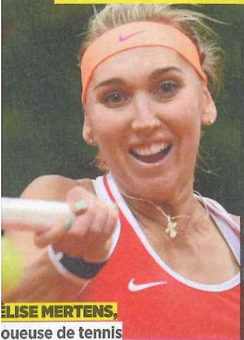
ELISE MERTENS, joueuse de tennis

La Limbourgeoise a subjugué la Belgique entière en atteignant la demi-finale du grand Chelem de Melbourne en janvier dernier. Mais la nouvelle star du tennis féminin belge a encore tout à construire et à 22 ans à peine, tous les espoirs sont permis pour celle qui a déjà intégré le top 20 mondial. Du haut de son 1,79 m, elle a tout d'une grande.